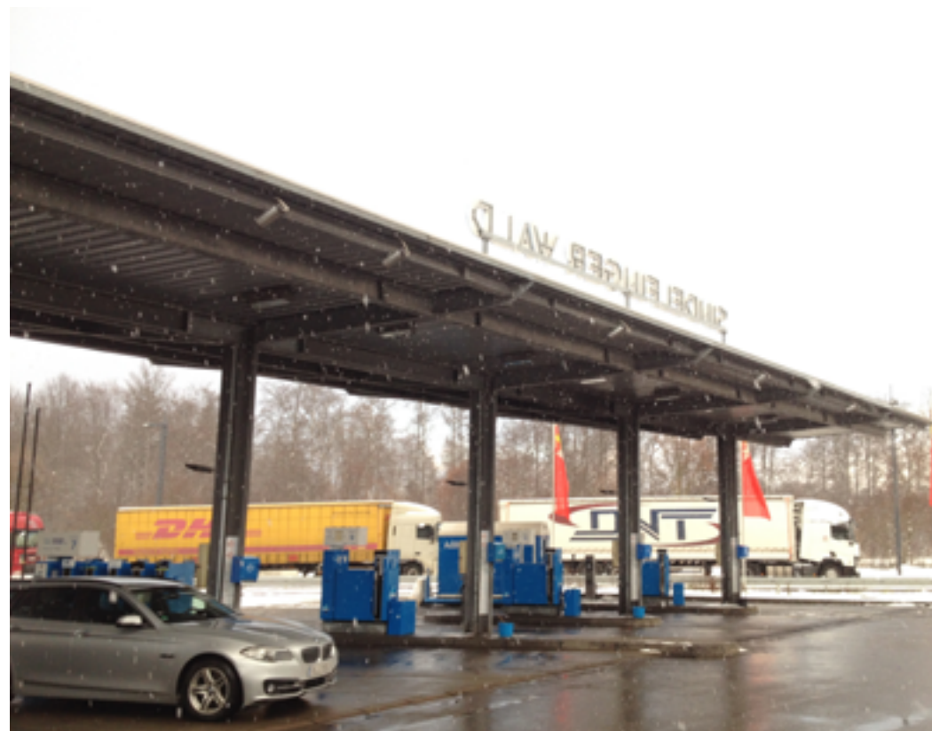
Snežilo o sto šesť

Inak celkom sa chumelilo. Na benzínke sme chvíľu pobudli, ale povedali sme si, že dáme rekord a chceme ísť ďalej. Riaditeľ nám povedal, aké ŠPZ máme hľadať, keď chceme ísť smer Mníchov. Pár ľudí sme sa spýtali a asi po 10 minútach sa pýtame jedného tmavšieho človeka, ktorý nám síce veľmi nerozumie, ale hovorí, že München Ja, Ja, Ja.