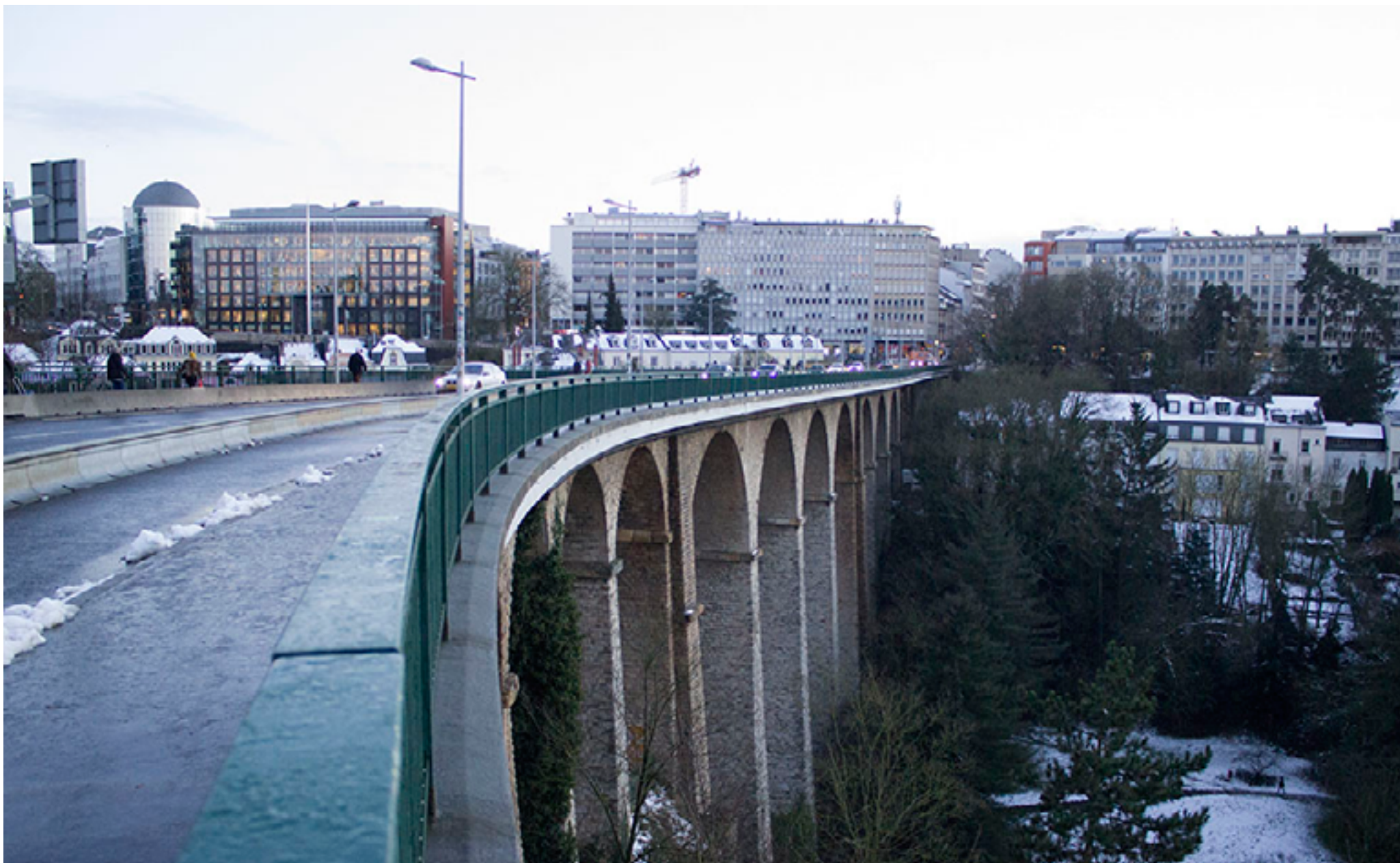
Most, ktorý spája časti mesta