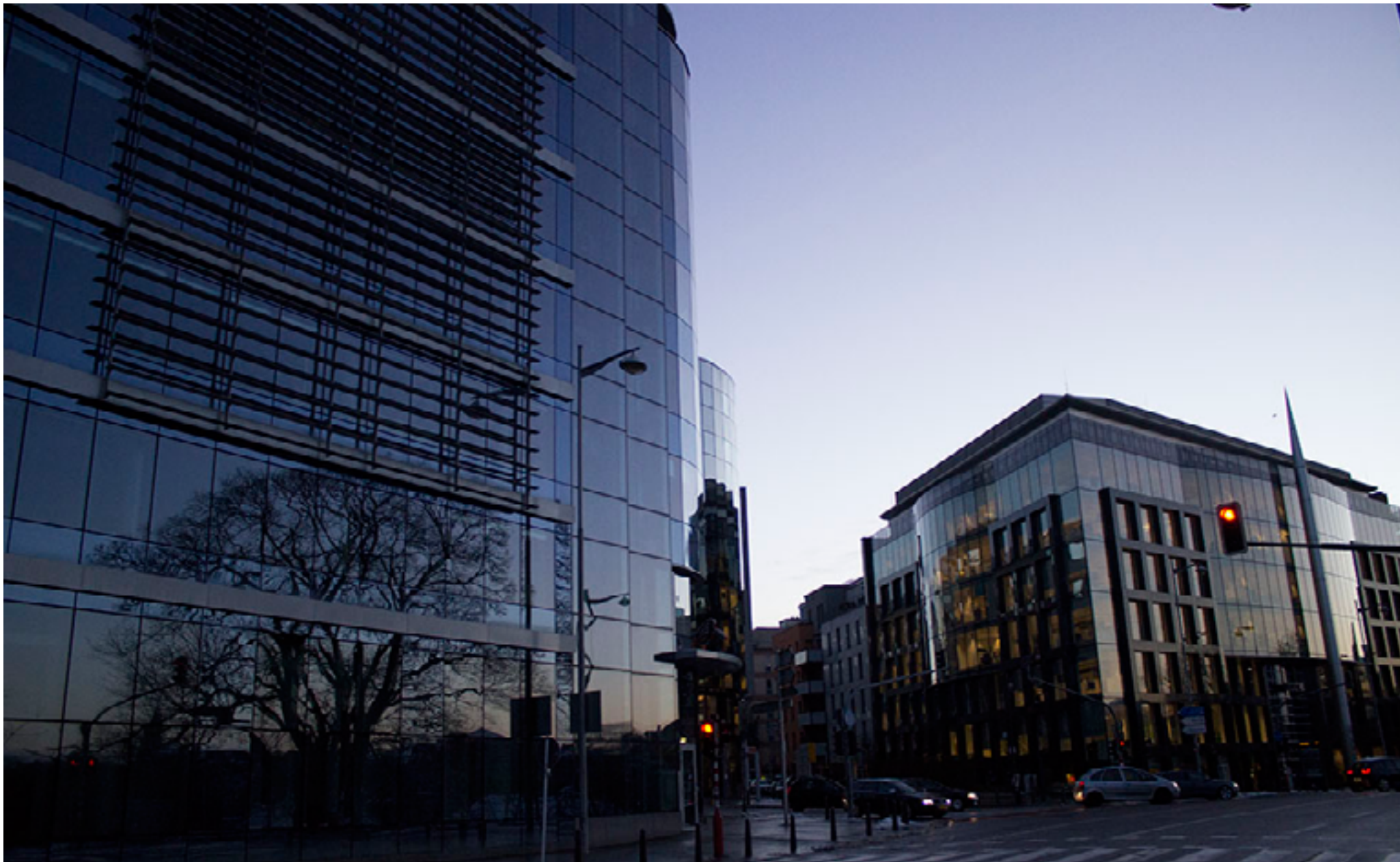
Druhá část mesta