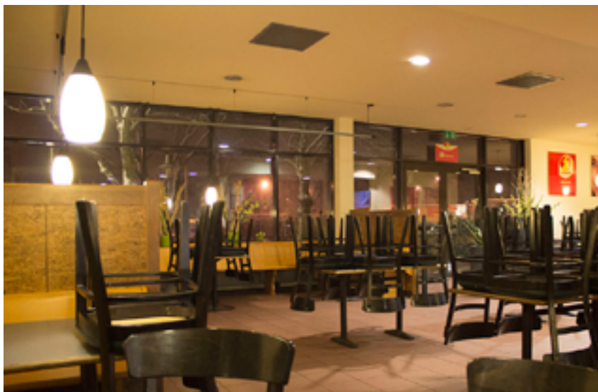
Prázdna reštaurácia na pumpe.

Nastupujeme do BMW X3 a máme namierené k mestu Mníchov. S týmito páňmi sme klasicky kecali o tom kam ideme, odkiaľ ideme a s akými ľuďmi sme zatiaľ išli a čo sa nám všetko stalo. Naša cesta trvala asi 40 minút. Keď sme prišli k pumpe, vystúpili sme z auta a mohlo byť tak pol dvanástej. Na tejto pumpe nebola až taká premávka ako na predchádzajúcej. Bolo tam tak 1 auto. Ale to nás netrápilo. My sme si povedali, že keď prídeme k Mníchovu, dáme si minimálne pol hodinku prestávku a vychutnáme si horúcu voňavú kávu. A tak sa aj stalo. Rozložili sme sa vnútri na jednom stole. Okrem nás tam nikto nebol. Keď nerátam týpka, ktorý sedel pri (ne)výherných automatoch a beznádejne vhadzoval dovnútra mince. My sme si na stole vytiahli papierovú mapu, pozreli cestu, kam budeme ďalej postupovať. Medzitým sa mi nabíjal iPhone. Po asi pol hodinke sme sa vybrali von z prázdnej “kaviarne” a že pôjdeme ďalej.