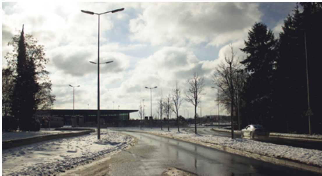
Letisko v Luxemburgu, odkiaľ sme stopovali do Nemecka.

cestu. Plán bol nasledovný, teda bol taký istý ako deň predtým. Urobili sme si ešte prechádzku mestom, ale trošku sme zabľúdili v uličkách. Neľutujem to. Videli sme fakt pekné domčeky, zákutia a to mesto dýchalo takou vyspelou atmosférou. Po tejto minitour sme nasadli na free MHDčku a smer letisko.