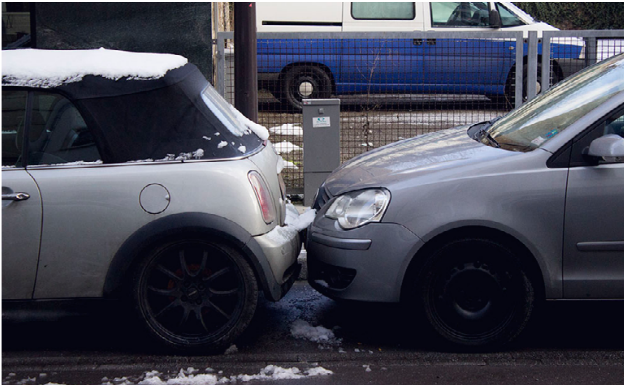
Parkovanie na tesnotku