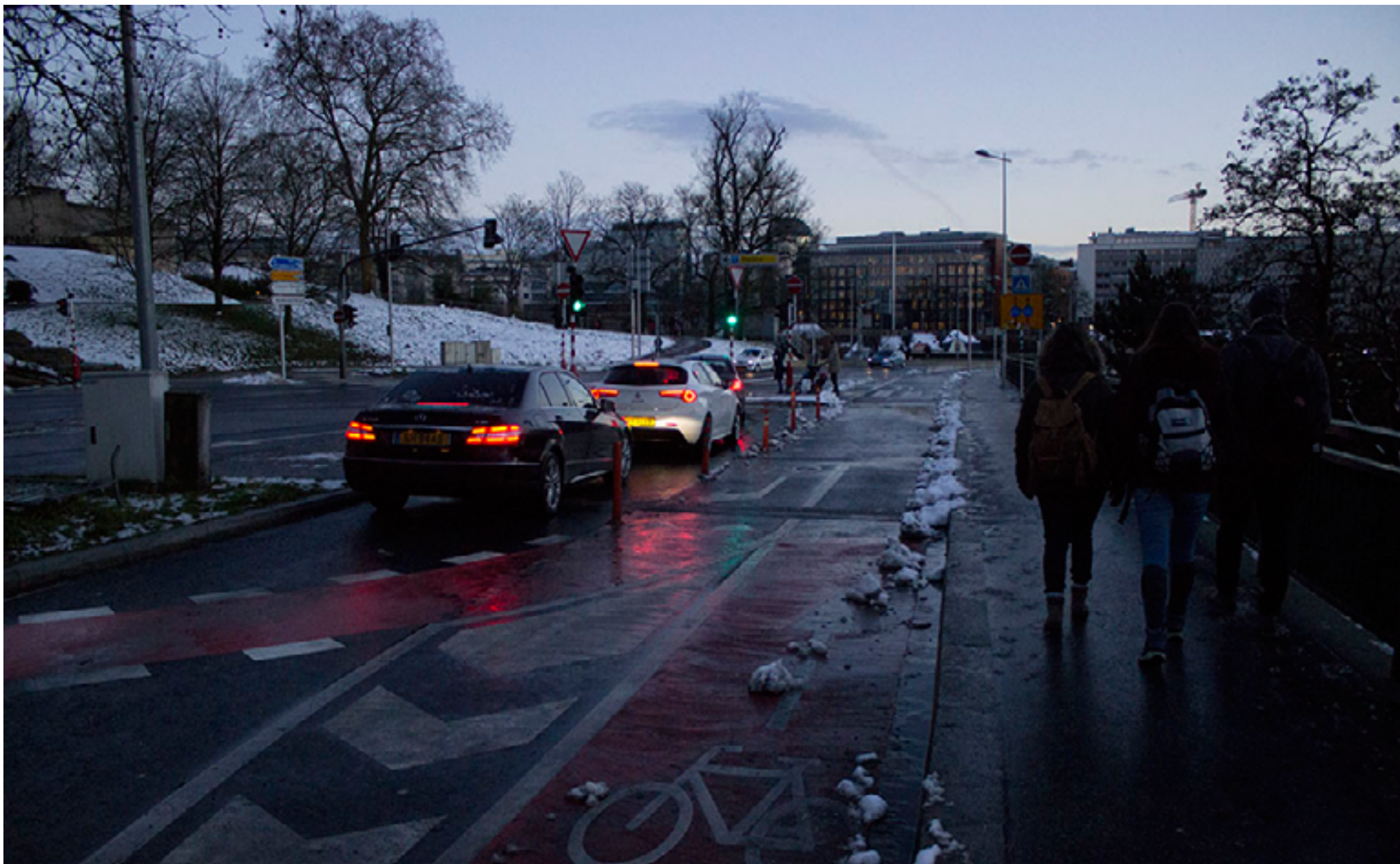
Vstup na most v Luxemburgu