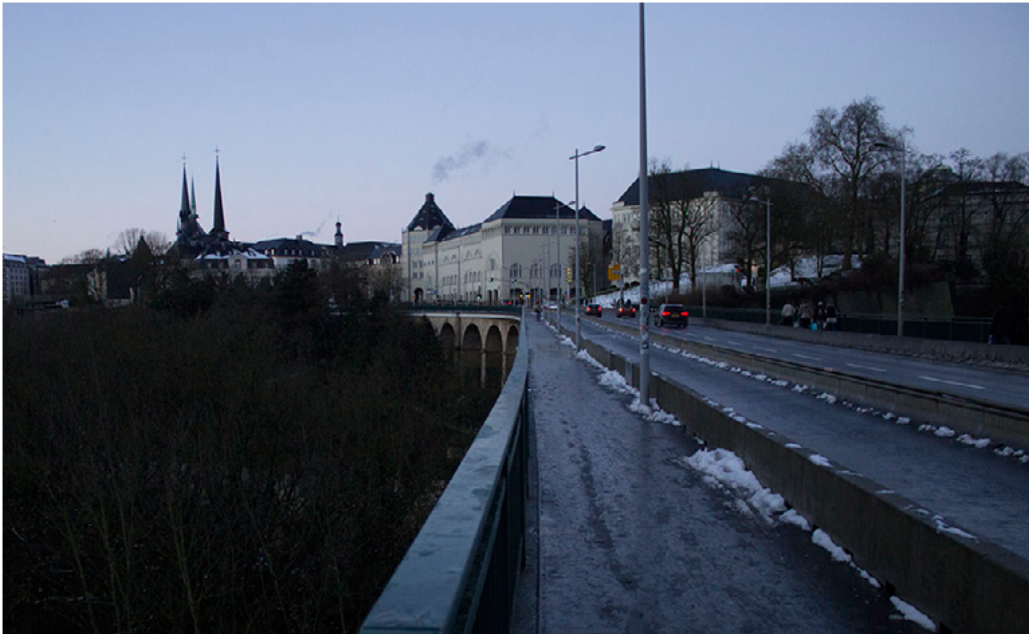
Pohľad z druhej strany