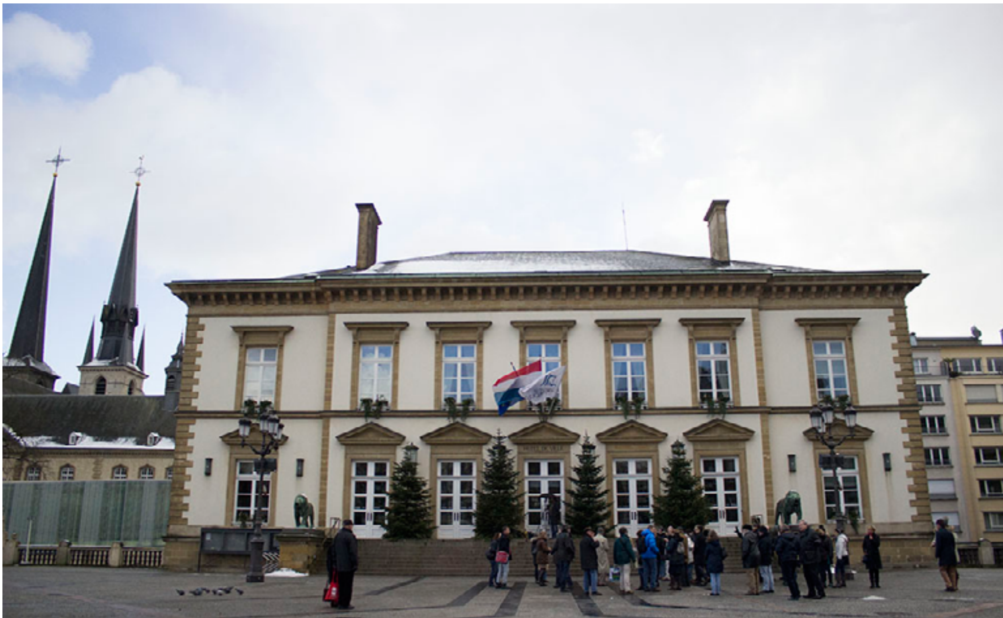
Námestie v Luxemburgu