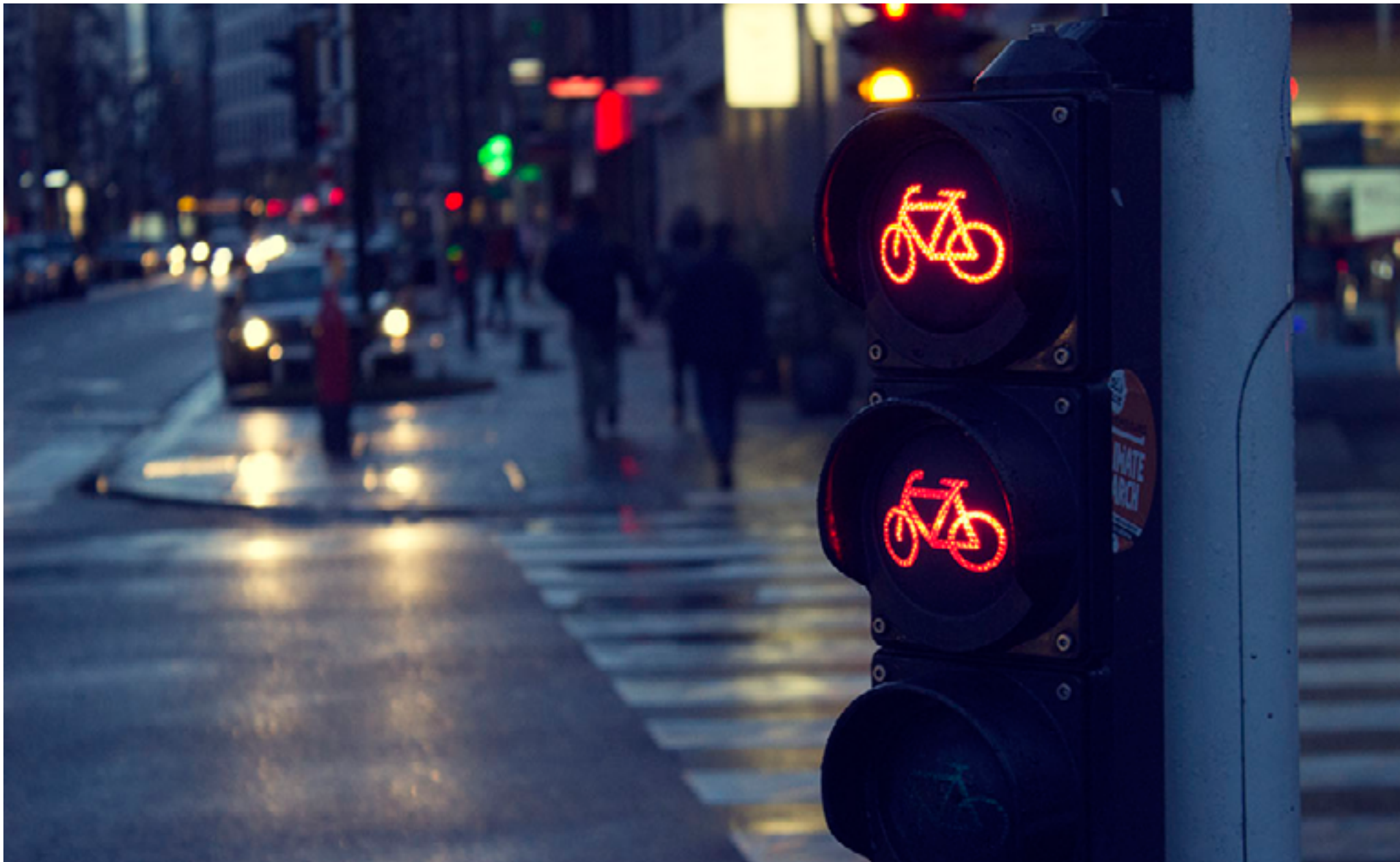
Semafor pre cyklistov