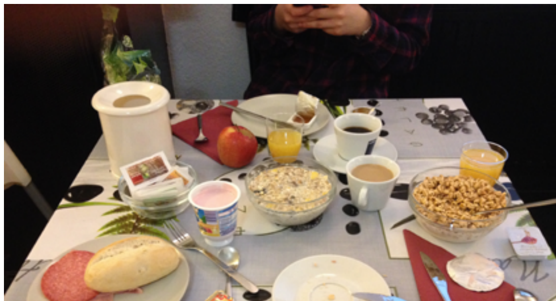
Raňajky. Bolo toho ešte oveľa viac.

Je nedeľa ráno. Budík sme si nastavovali, aby sme spali aspoň tých 7-8 hodín. Poviem vám, že tak dobre som sa už dávno nevyspal. Ale nie je to až tak nečakané, keďže som nespál približne 36 hodín vkuse. Možno to je aj môj rekord. O 9 sme mali mať dole raňajky. Zjedol som toho asi za troch, ale to pri mne nie je nejako výnimočné. Veď posúďte sami, pripájam fotku. Mňam.